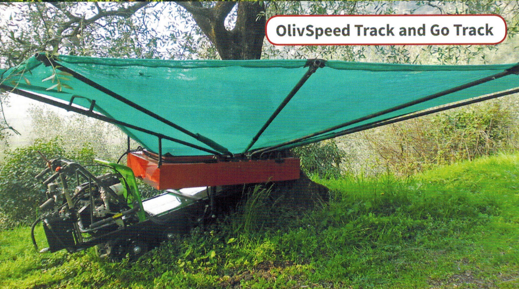
OlivSpeed Track and Go Track

Uno speciale Kit idraulico manuale, abbinato alla macchina stessa, permette di effettuare comodamente le operazioni di apertura, chiusura ed inclinazione dell'ombrello.