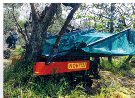
OlivSpeed Go Track