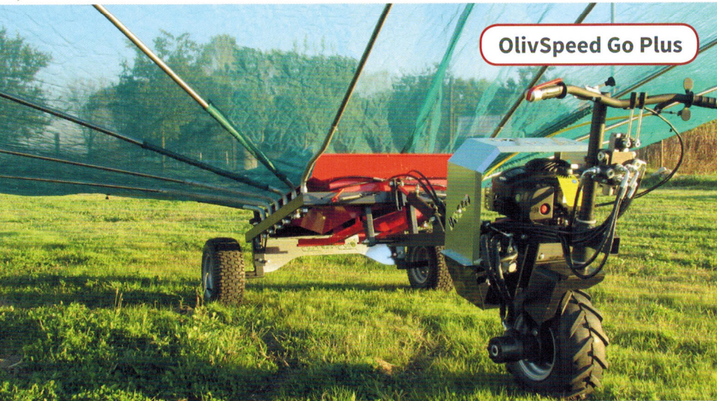
OlivSpeed Go Plus

OlivSpeed è realizzato dalla BOSCO Macchine Agricole.