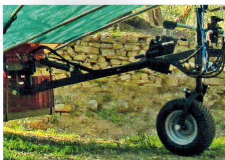
Kit idraulico manuale per OlivSpeed Plus