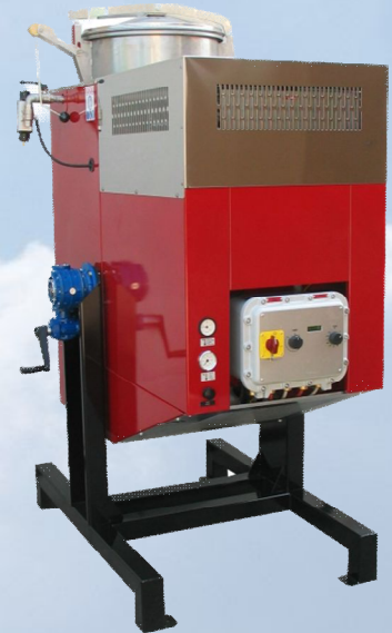
Di160 Ax LCD