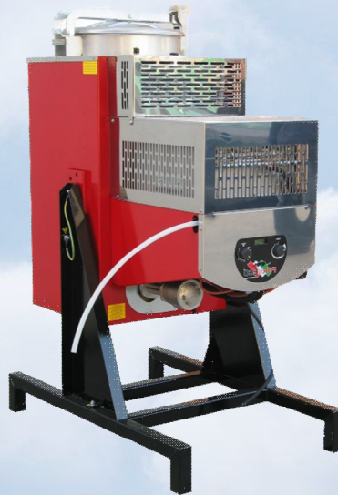
Di60 Ax LCD