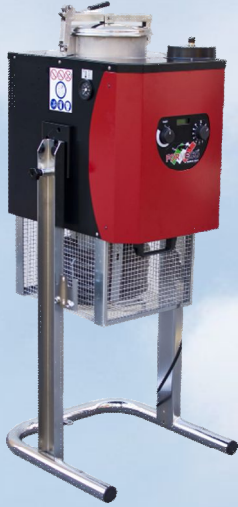
Di15 Ax LCD