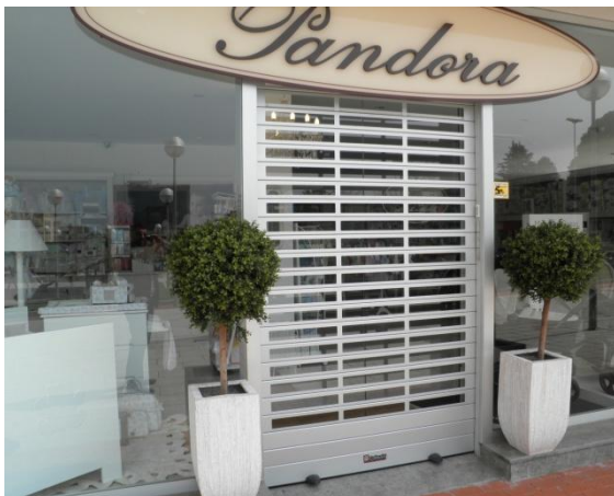
Mod. SATEN anodizado Plata Mate