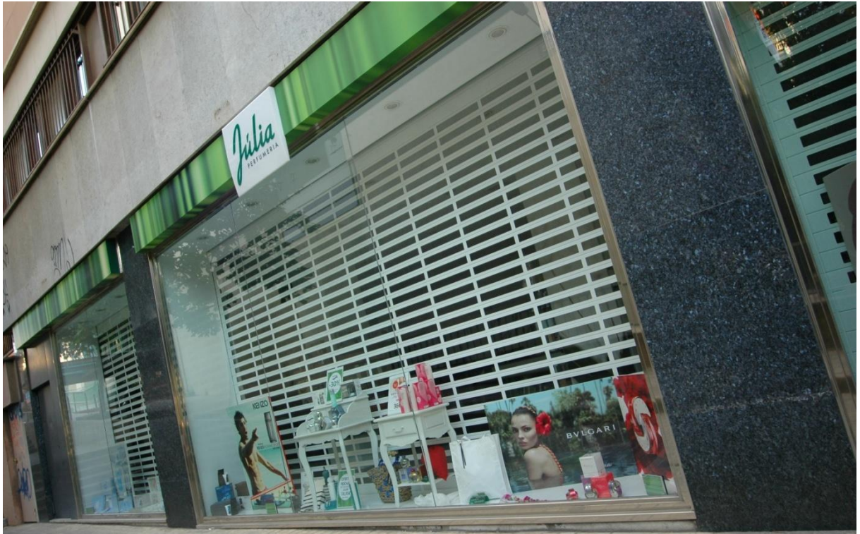
Mod. SATEN anodizado Plata Mate

Máxima visión para su comercio + policarbonato