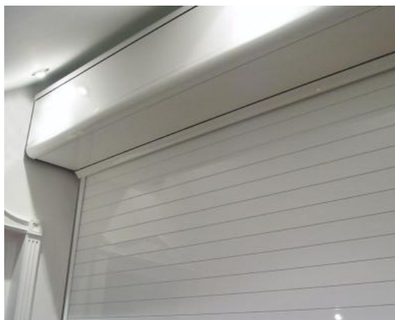
Cajón BASICPLUS aluminio + Guía 95x40