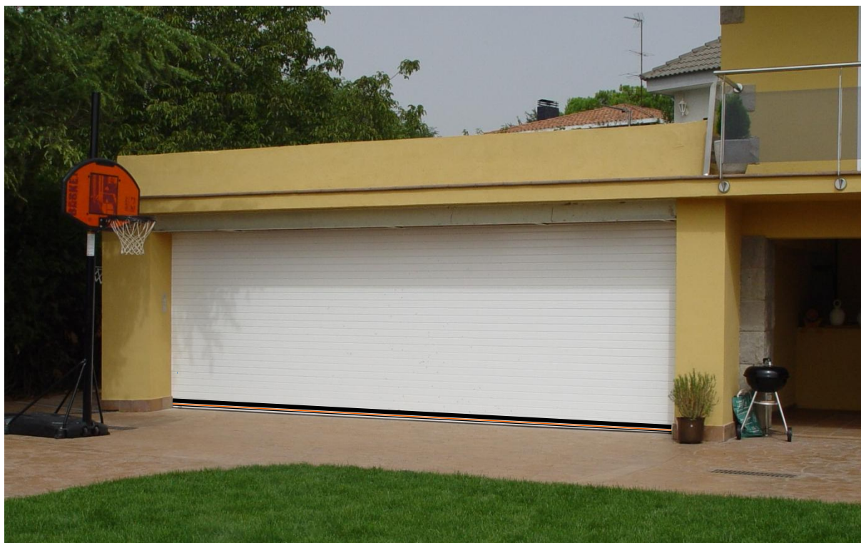
Mod. MASTER TERMIC Lacada en RAL 9010