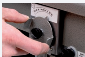
Paso 1 Ajuste de guías al diámetro apropiado.