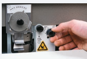
Paso 2 Ajuste del ángulo de corte y cabezas de curva.