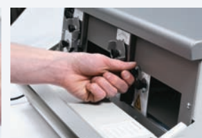
Paso 5 Ajuste del deslizador derecho.