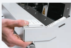
Paso 3 Ajuste de la mesa delantera.