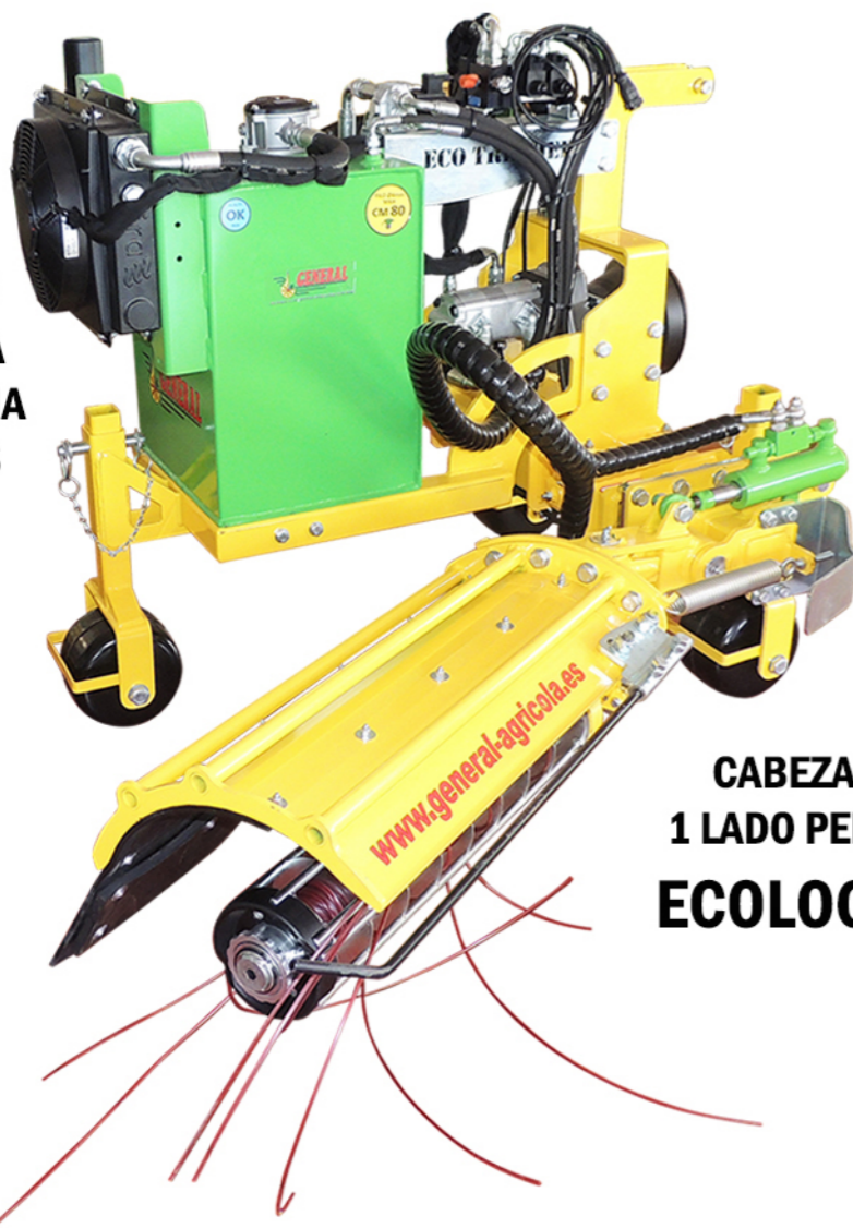
ESTABILIDAD GARANTIZADA POR EL SISTEMA DE 3 RUEDAS