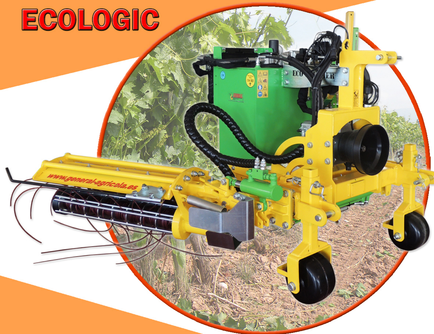
CABEZAL 1 LADO PELOS ECOLOGIC