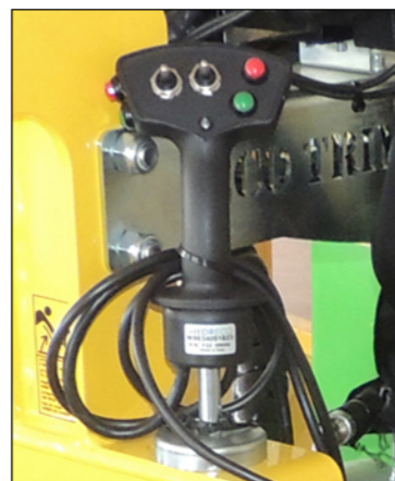
DISTRIBUIDOR ELECTROHIDRÁULICO CON JOYSTICK