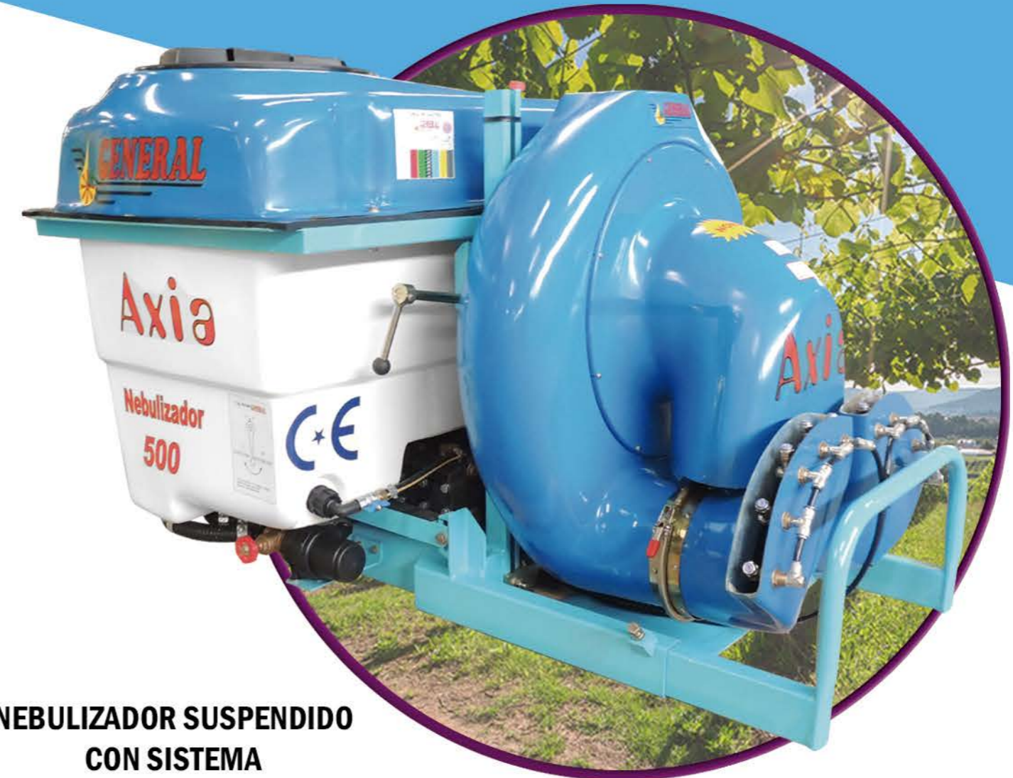
NEBULIZADOR SUSPENDIDO CON SISTEMA PARRA PARRALES