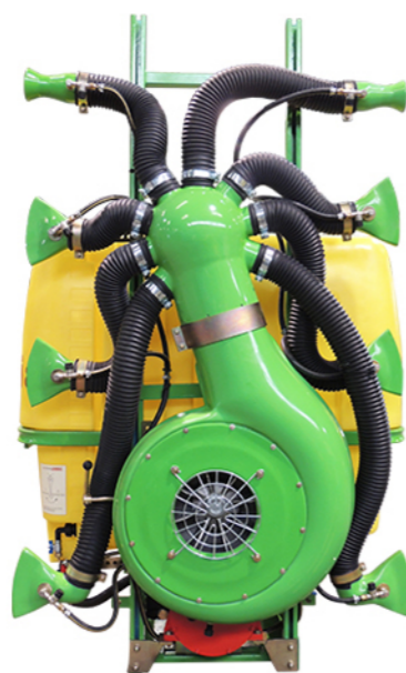
DEPÓSITO DE POLIETILENO