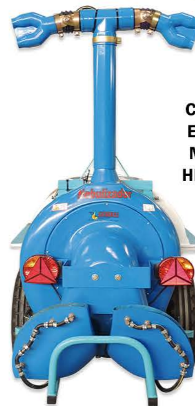
CON TORRE ELEVACIÓN MANUAL O HIDRÁULICA