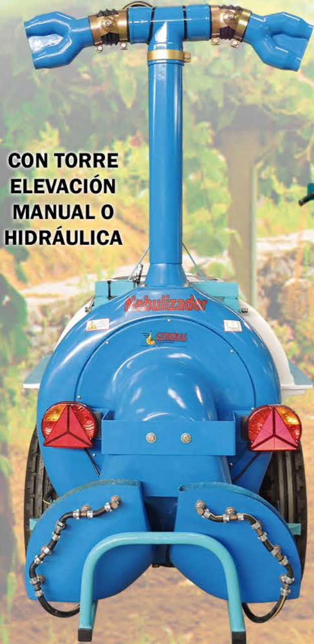
CON TORRE ELEVACIÓN MANUAL O HIDRÁULICA

Estas máquinas se fabrican en la versión SERIE CORTA muy reducidos, compactos y reforzados denominados ESPECIAL VIÑA capaces de trabajar en terrenos muy reducidos y difíciles, esto hace que estas máquinas sean muy manejables, duraderas y de ALTO RENDIMIENTO.