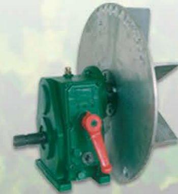
GRUPO MULTIPLICADOR DE ACERO REFORZADO EN BAÑO DE ACEITE