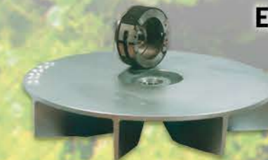
TURBINA 5200 DE DUROALUMINIO EMBRAGUE DE MASAS CON FERODOS