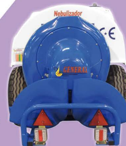
DE SERIE CON DOS TESTAS ORIENTABLES

ESTE NEBULIZADOR HACE LA GOTA MÁS FINA Y CONSIGUE PENETRAR MEJOR. AL SER LAS GOTAS MÁS FINAS CONSIGUE MÁS IMPACTOS POR CENTÍMETRO CUADRADO POR LO QUE MOJA MEJOR CON MENOS CANTIDAD DE LÍQUIDO Y PENETRA MÁS DENTRO DE LOS FRUTOS. AL TRABAJAR CON MENOS LÍQUIDO BAJO VOLUMEN CONSEGUIMOS MENOS CONDENSACIÓN DENTRO DE LOS PARRALES POR LOS QUE LOS FRUTOS SON MÁS SANOS Y DE MEJOR CALIDAD, DEJÁNDOLOS MÁS SECOS.