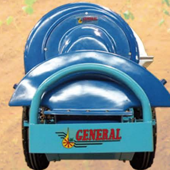
UNA TESTA COBERTURA TOTAL