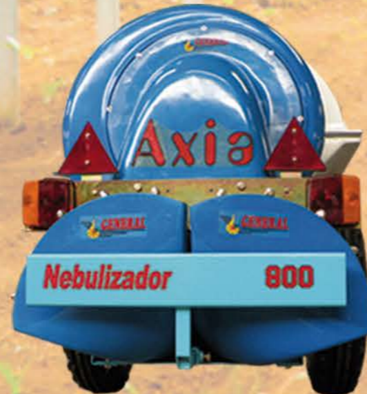
DOS TESTAS ORIENTABLES