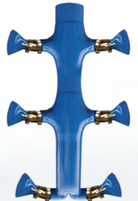
3 MANOPLAS POR FILA 6 COLECTORES 225Ø