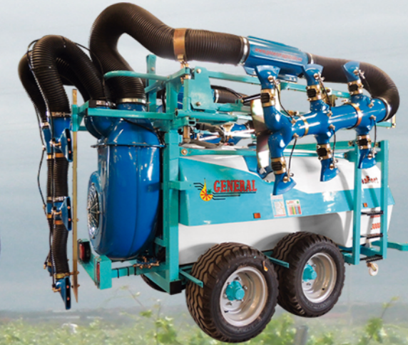
EJE TÁNDEM PARA TERRENOS DIFÍCILES

Estas máquinas están equipadas con una doble turbina centrífuga de gran caudal y alta velocidad de aire para poder atravesar bien las cepas en vaso las cuáles requieren una gran potencia de aire para poder conseguir llegar a las uvas. Con solo dos tubos de 225 Ø conseguimos más cantidad y mayor velocidad de aire, el cual no se reparte y divide a la salida de la turbina, haciéndolo al final, por encima de la cepa. Gracias a sus enormes manoplas de salida dotadas de 5 boquillas consigue remover bien las cepas y penetrar hasta el centro de las mismas. Estos nebulizadores pueden hacer tratamientos MIXTOS solo con líquido o con polvo y también con líquido y polvo a la vez, además son especiales para bajo volumen y volumen alto sin modificaciones.