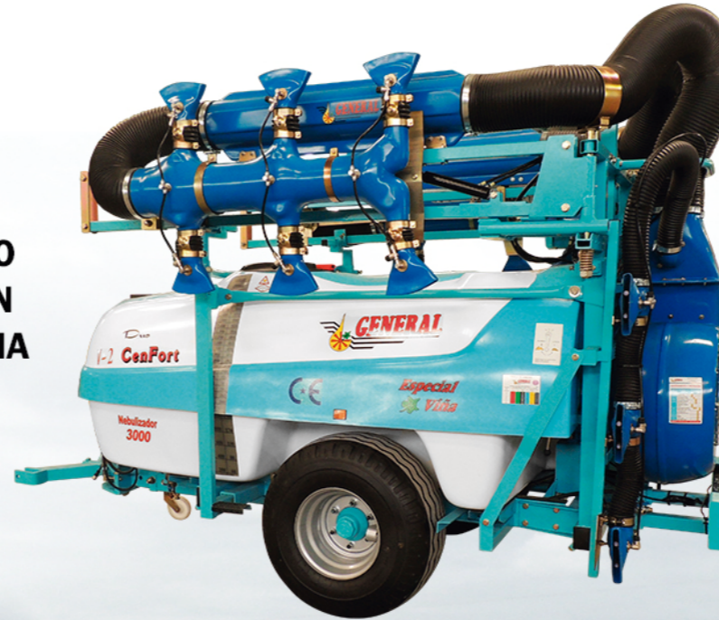
RECOGIDO EN ORDEN DE MARCHA