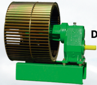
CONJUNTO DOBLE TURBINA 510 Ø