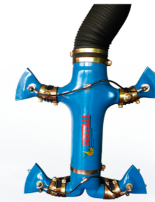
CANALIZADOR EN DOBLE CRUZ