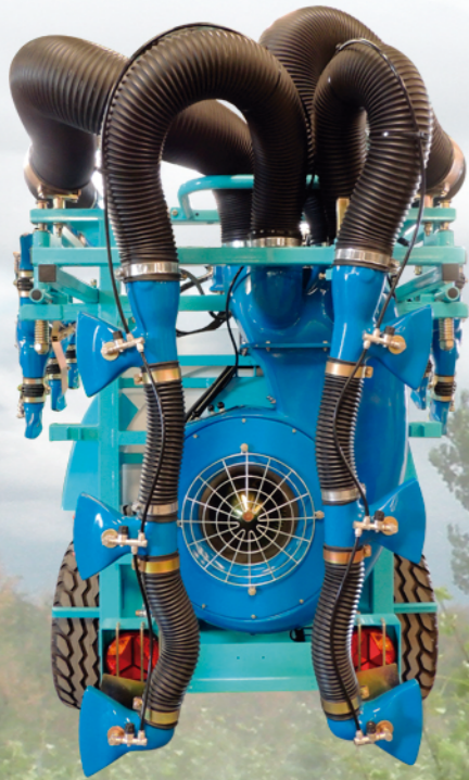
DISPOSICIÓN DE MANOPLAS PARA CULTIVOS ESTRECHOS