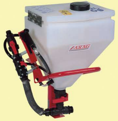
DOSIFICADOR DE PRODUCTOS