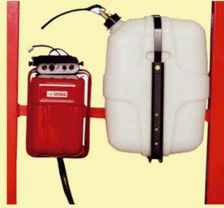
EQUIPO MARCADOR DE ESPUMA ELÉCTRICO