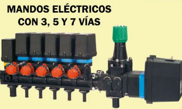
MANDOS ELÉCTRICOS CON 3, 5 Y 7 VÍAS