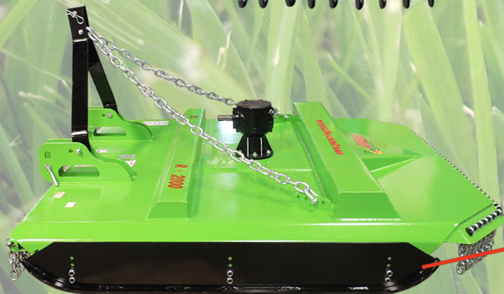
PATINES REGULABLES EN ALTURA