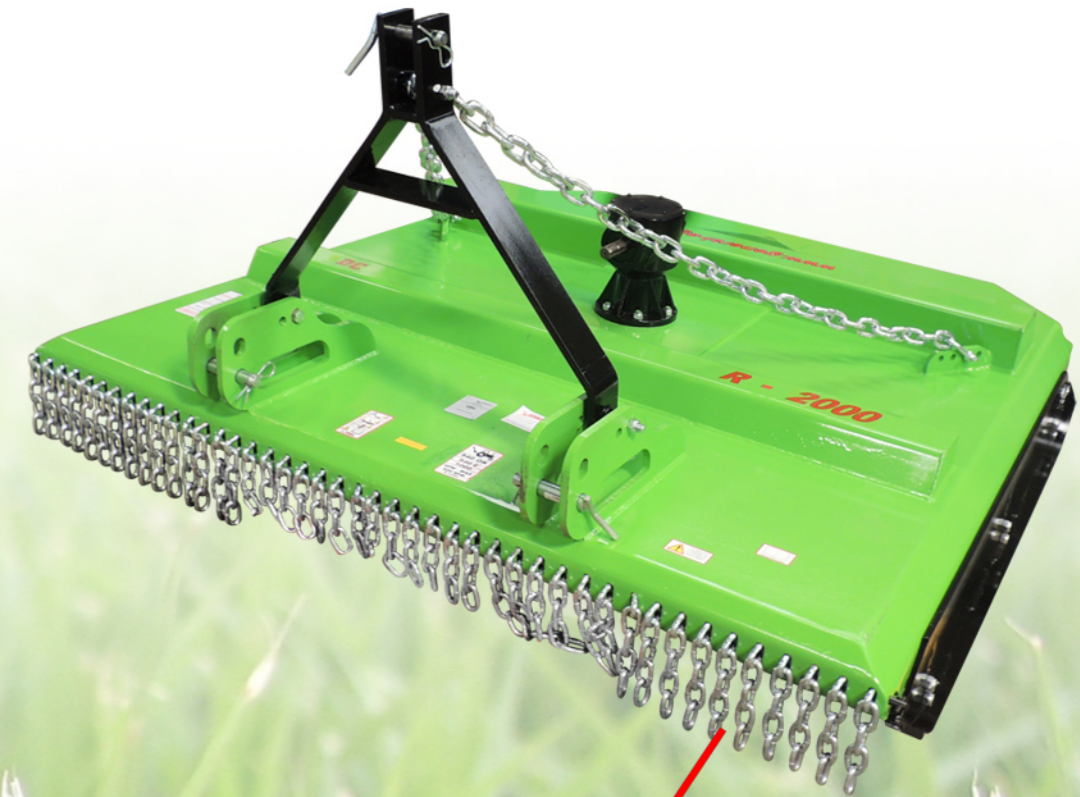
CADENAS TRASERAS DE PROTECCIÓN