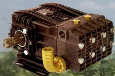
BOMBA DE PISTONES DE CERÁMICA

MÁQUINAS CON BRAZOS PARA VIÑA SUBIR Y BAJAR Y PLEGAR HIDRÁULICAMENTE