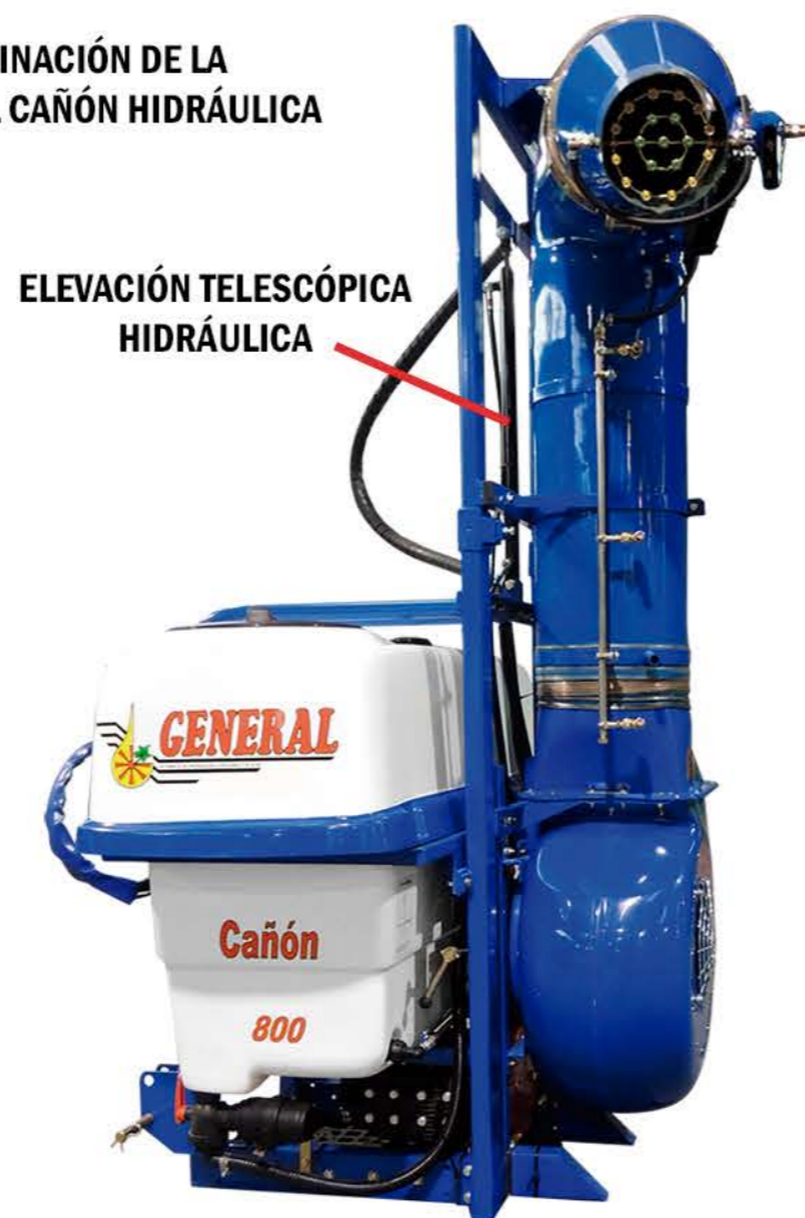
ELEVACIÓN TELESCÓPICA HIDRÁULICA