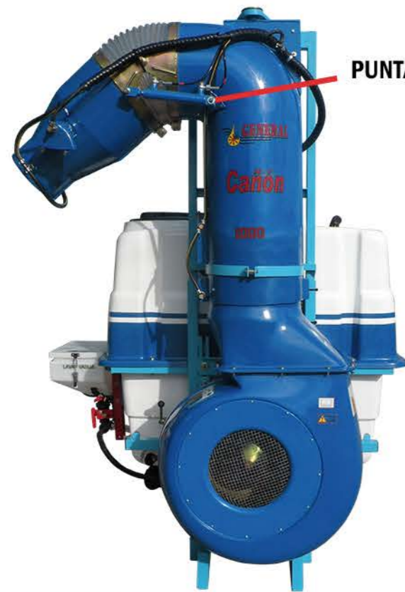
INCLINACIÓN DE LA PUNTA DEL CAÑÓN HIDRÁULICA