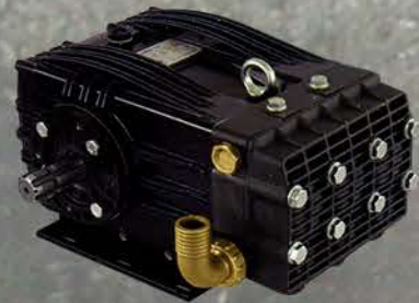
BOMBA DE PISTONES DE CERÁMICA

PARA TRATAMIENTOS DE ÁRBOLES A GRAN ALTURA O PLANTACIONES MUY ANCHAS