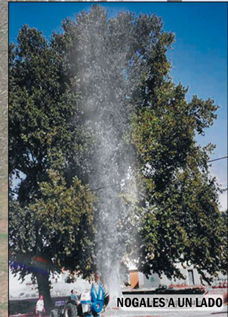
NOGALES A UN LADO