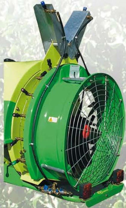
ALERONES DE PALMETA