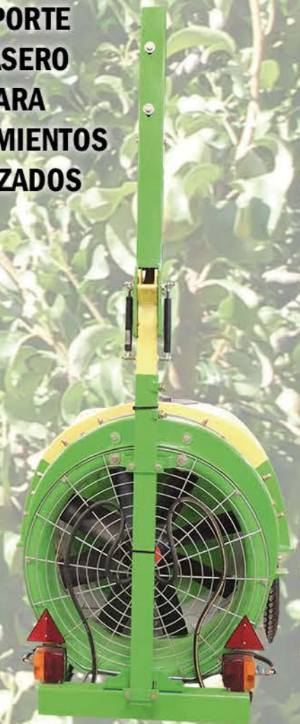
SOPORTE TRASERO PARA TRATAMIENTOS CRUZADOS