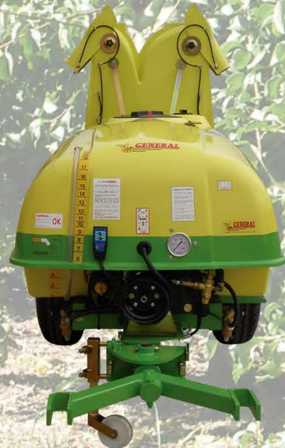
TORRE DE OLIVOS