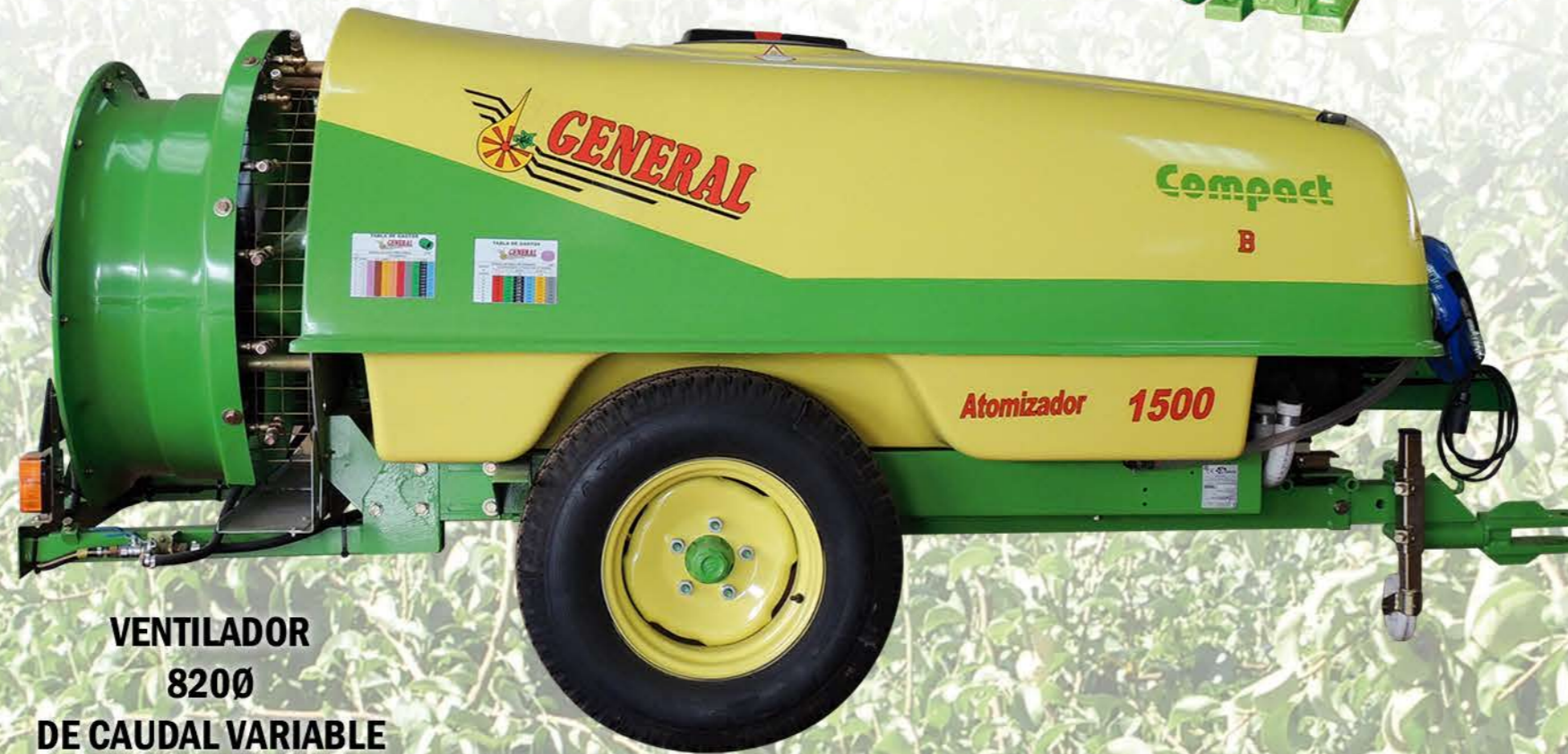
VENTILADOR 820Ø DE CAUDAL VARIABLE