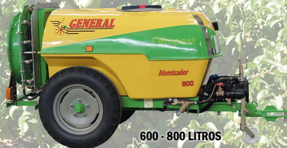
600 - 800 LITROS