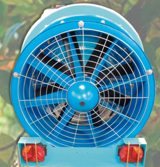
TURBOCANALES DE ENTRADA DESMONTABLES Y CON LA PALA MUY ANCHA PARA ORIENTAR MEJOR LA DIRECCIÓN DEL AIRE