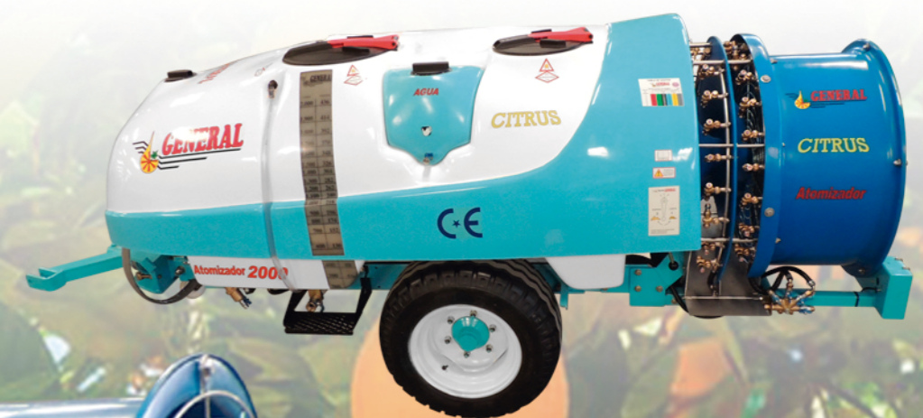
LAVAMANOS Y LAVACIRCUITOS INTEGRADOS EN LA CUBA