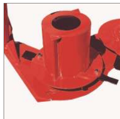
2 Tamburi laterali

Flessibile di prima e seconda categoria per adattarsi a ogni esigenza di trazione