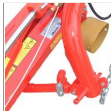
6 Sistema di sicurezza

La barra di taglio è equipaggiata con rinforzi in acciaio antiusura temprati. Permette, così, di lavorare a grande velocità anche in terreni accidentati