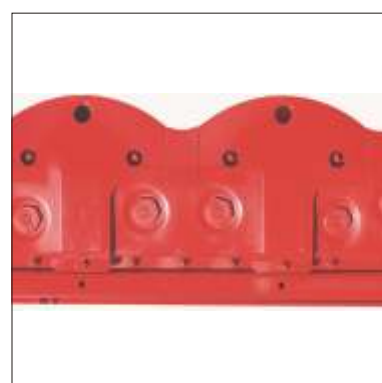
5 Barra di taglio rinforzata

Permettono di ridurre ulteriormente la larghezza dell'andana facilitando il passaggio delle ruote del trattore.