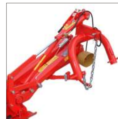
7 Sollevamento verticale

Il punto di fulcro della sicurezza è situato nell'asse del timone. Questa disposizione permette un adeguato arretramento in tutta sicurezza anche a velocità sostenute.