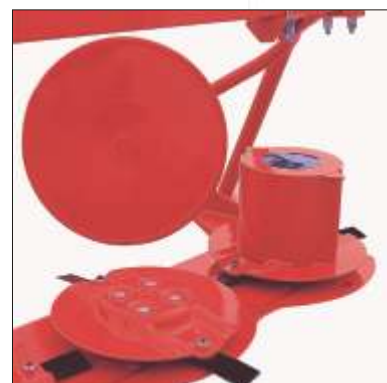
4 Dischi andanatori (optional)

La molla di sospensione agisce sull'intera barra di taglio riducendo fortemente l'usura dei pattini di controllo. Un'etichetta indica la regolazione ottimale della sospensione.