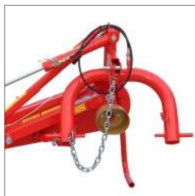
1 Attacco a tre punti

Flessibile di prima e seconda categoria per adattarsi a ogni esigenza di trazione