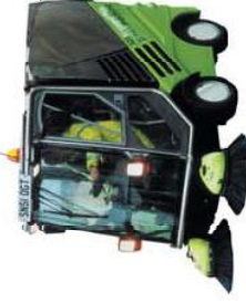
APPLIED 525 AV

Barredora hidrostática de aspiración de 0,75 m 3 de capacidad de tolva. Construida enteramente en acero inoxidable de alta calidad. Ancho máximo de barrido de 18 metros. Eje delantero extensible para una mayor estabilidad. Tracción a las cuatro ruedas. Ancho de carrocería de 1,10 metros para una gran accesibilidad.