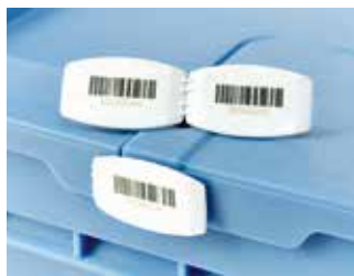
Precintos con códigos de barras