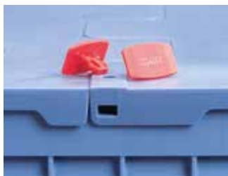
Precintos de seguridad