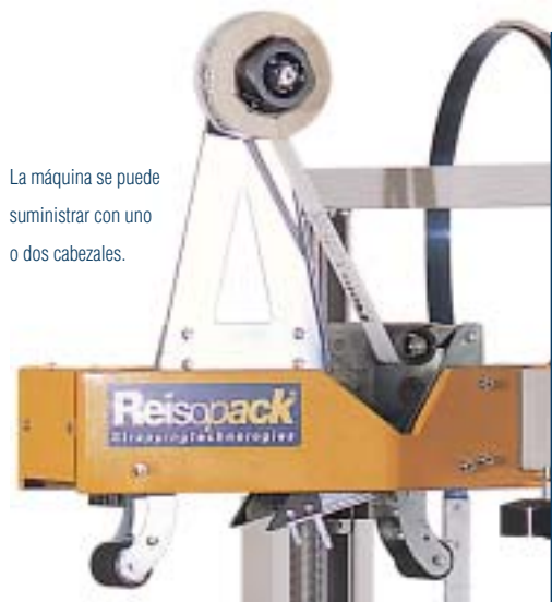
La máquina se puede suministrar con uno o dos cabezales.