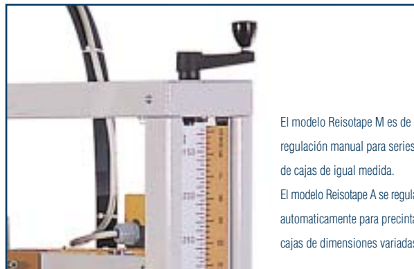
El modelo Reisotape M es de regulación manual para series de cajas de igual medida. El modelo Reisotape A se regula automáticamente para precintar cajas de dimensiones variadas.