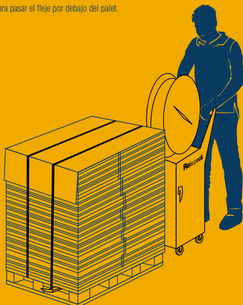
La máquina se desplaza manualmente hacia el palet evitando mover la carga antes del flejado.