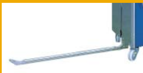
La máquina dispone de una lanza telescópica para pasar el fleje por debajo del palet.