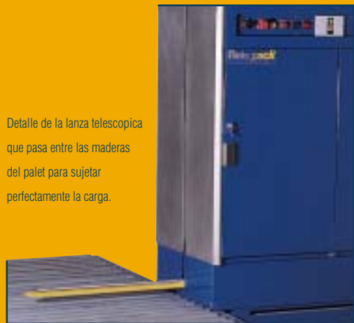
Detalle de la lanza telescópica que pasa entre las maderas del palet para sujetar perfectamente la carga.