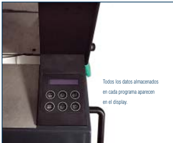
Todos los datos almacenados en cada programa aparecen en el display.