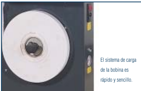
El sistema de carga de la bobina es rápido y sencillo.