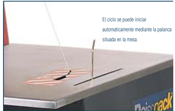
El ciclo se puede iniciar automáticamente mediante la palanca situada en la mesa.