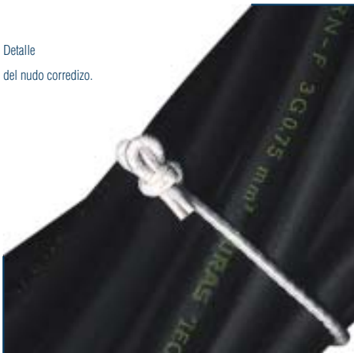
Detalle del nudo corredizo.