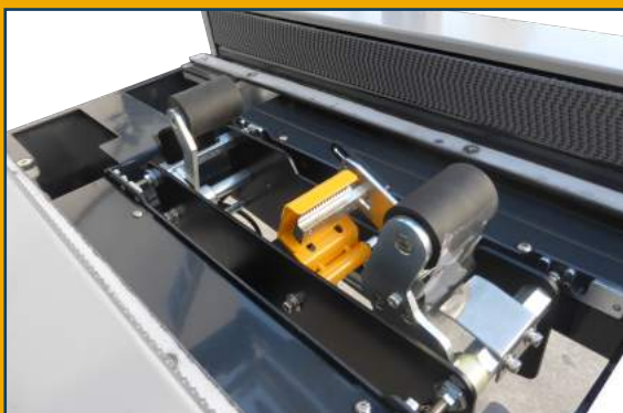
Doble cabezal de precintado superior e inferior