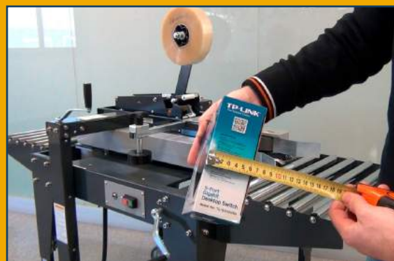
Compatible con gran variedad de tamaños de caja