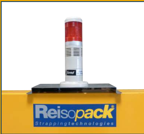
El señalizador acústico y visual avisa de errores de la máquina y del agotamiento de la bobina de fleje.