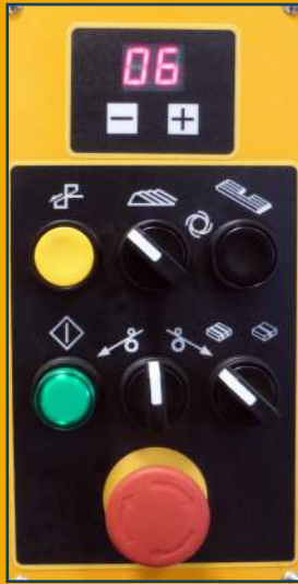
Panel de control de la AT 1904 con regulador digital LED para ajustar la tensión.

Máquina flejadora totalmente automática de alta velocidad y máxima eficiencia para fleje de Polipropileno.