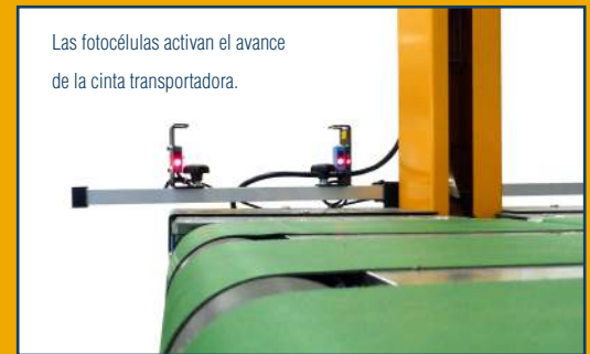
Las fotocélulas activan el avance de la cinta transportadora.