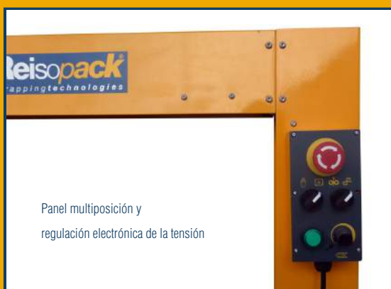
Panel multiposición y regulación electrónica de la tensión

Máquina flejadora automática de alta velocidad y máxima eficiencia para fleje de 5 mm.