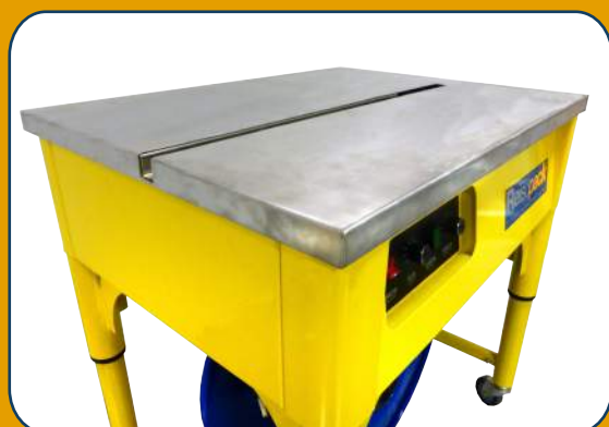
Mesa de trabajo metálica para una mayor resistencia