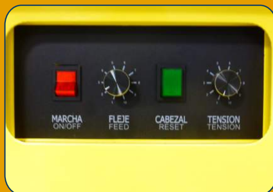
Permite regular la tensión y el fleje liberado tras cada flejada