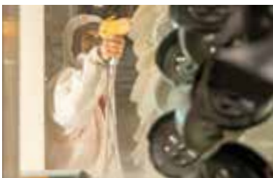
TRATAMIENTO DE SUPERFICIES Y LACADO INTEGRAL