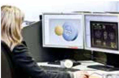
DISEÑO Y DESARROLLO DE PRODUCTO