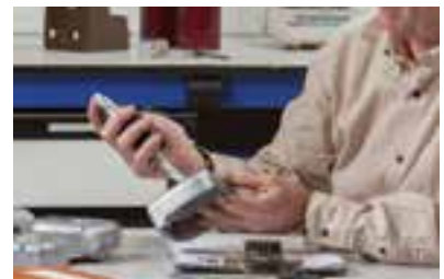
TRAZABILIDAD Y CONTROL DE CALIDAD