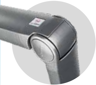
GAMA BRAZOS SPLENDOR