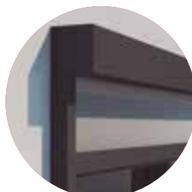
CIERRES VERTICALES KLAIS-110