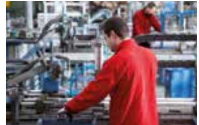
PRE-MONTAJE DE PRODUCTO