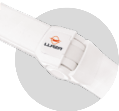
GAMA BRAZOS ART