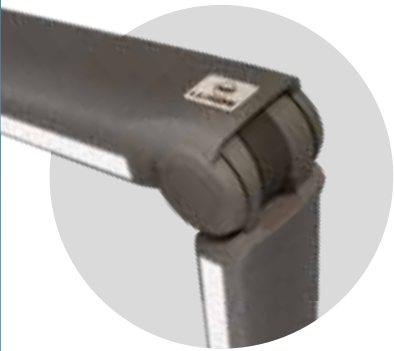
GAMA BRAZOS ONYX

La diversidad de propuestas HABITAT LLAZA garantiza la protección ideal para cada necesidad.