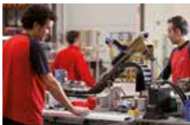
ENSAMBLAJE DE PRODUCTO