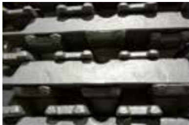
FUNDICIÓN POR GRAVEDAD E INYECCIÓN DE ALTA PRESIÓN