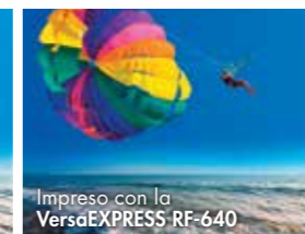
Impreso con la VersaEXPRESS RF-640