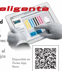
Disponible en iTunes App Store.

Con la RF-640, hemos introducido la Roland Printer Assist, una aplicación específica para tablets iPad que permite controlar las funciones de impresión de forma remota. Con esta nueva e intuitiva aplicación, podrá controlar el estado de la impresora y gestionar los trabajos cómodamente desde su iPad, para una comodidad y una eficiencia total.