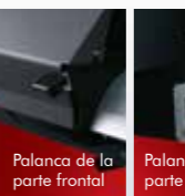
Palanca de la parte frontal