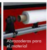
Abrazaderas para el material