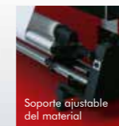
Soporte ajustable del material

Al igual que el resto de la línea de impresoras de Roland, la RF-640 es fácil de configurar y utilizar. El nuevo diseño del cartucho de tinta con carga frontal facilita la sustitución de la tinta a la vez que reduce el tamaño de la impresora. Las palancas de carga del material están situadas tanto en la parte frontal como en la posterior para una mayor comodidad. Unas abrazaderas especiales para el material permiten sujetar los rollos, por voluminosos que sean, al cargarlos en su posición y los soportes ajustables del material en ambos lados del sistema de recogida permiten sujetar incluso los rollos más estrechos.