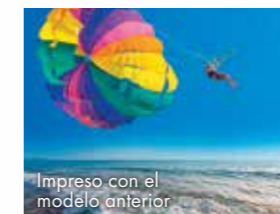
Impreso con el modelo anterior