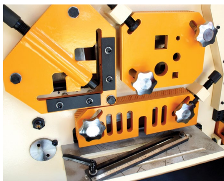
Estação para corte de perfis com esbarro automático

Capacidade até 165 Toneladas Dois postos de trabalho independentes Altamente versátil Punçõagem, guilhotina, corte de perfis e barras Mudança rápida de ferramentas Esbarros eléctricos