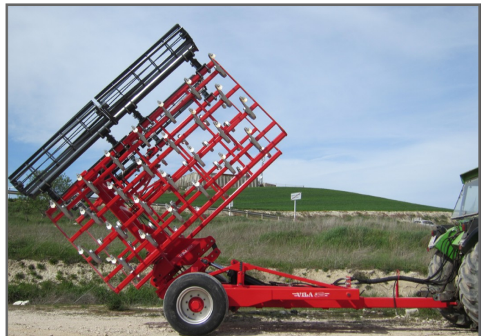
TRANSCOMBI B + VIBROCULTIVADOR 50x12 - 7 m - 54 BR.