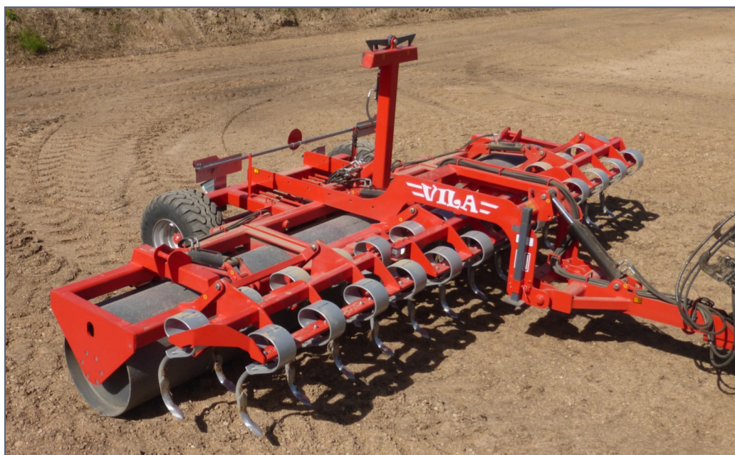
RAC - 6'70