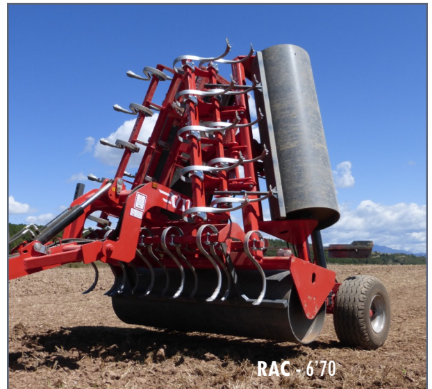
RAC - 6'70