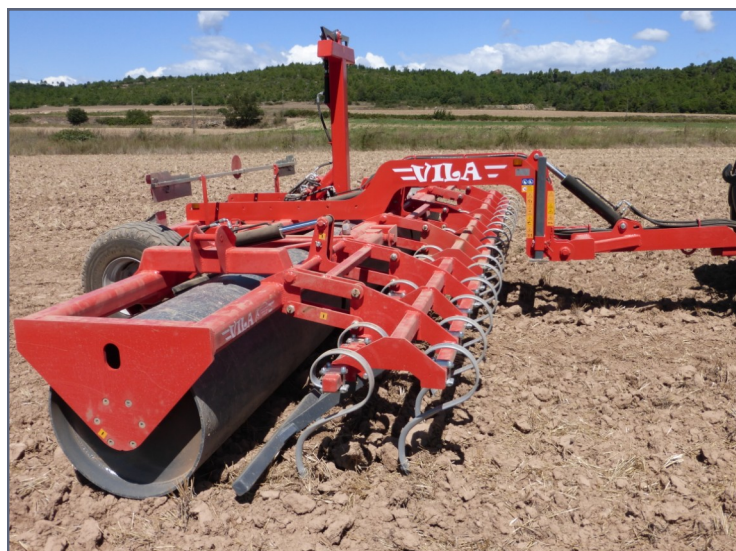
RAC - 6'70 con barra niveladora