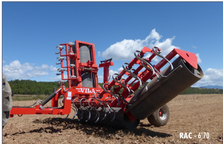
RAC - 6'70