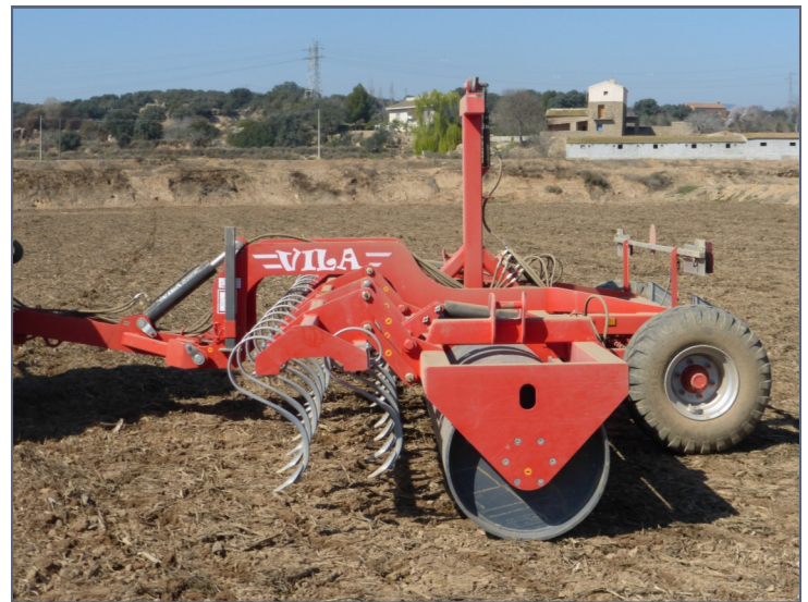
RAC - 6'70