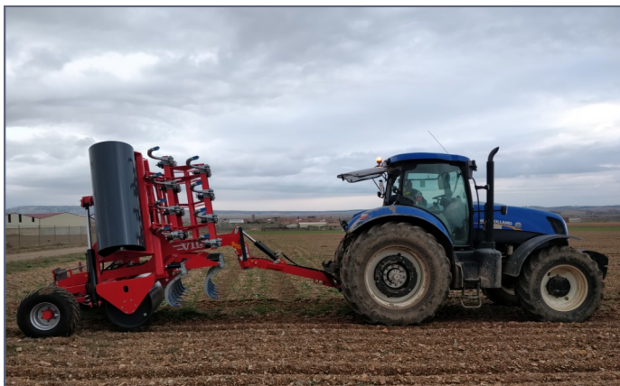
RAC - 6'20