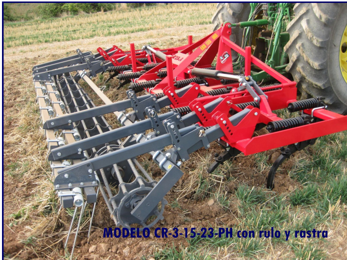
MODELO CR-3-15-23-PH con rulo y rastra