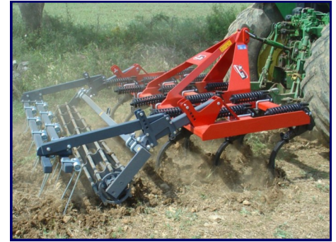
CR-3-13-F con rulo y rastra