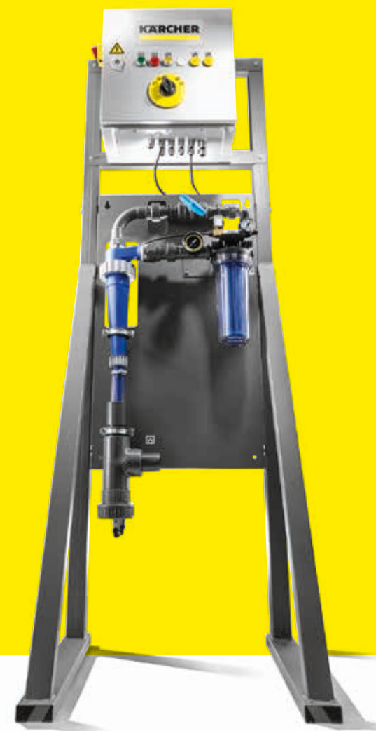
Sistema de reciclaje de agua WRP Car Wash

También hechos. La protección medioambiental y la sostenibilidad están en boca de todos. Esta es nuestra y su contribución al tema.