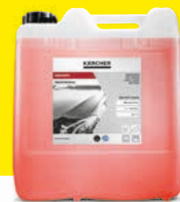
Cera caliente Classic RM 820

Perfectos para CW 1 Klean!Fit: los detergentes de la gama Classic