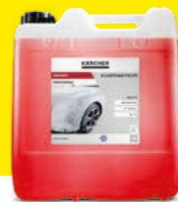
Detergente con efecto brillo en espuma RM 837