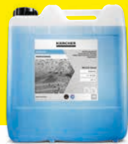
Agente de secado Classic RM 829