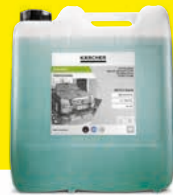
Espuma activa Classic RM 812