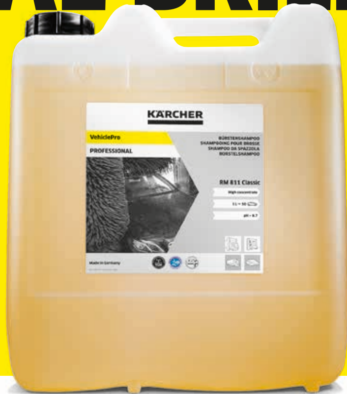
Champú para cepillos Classic RM 811