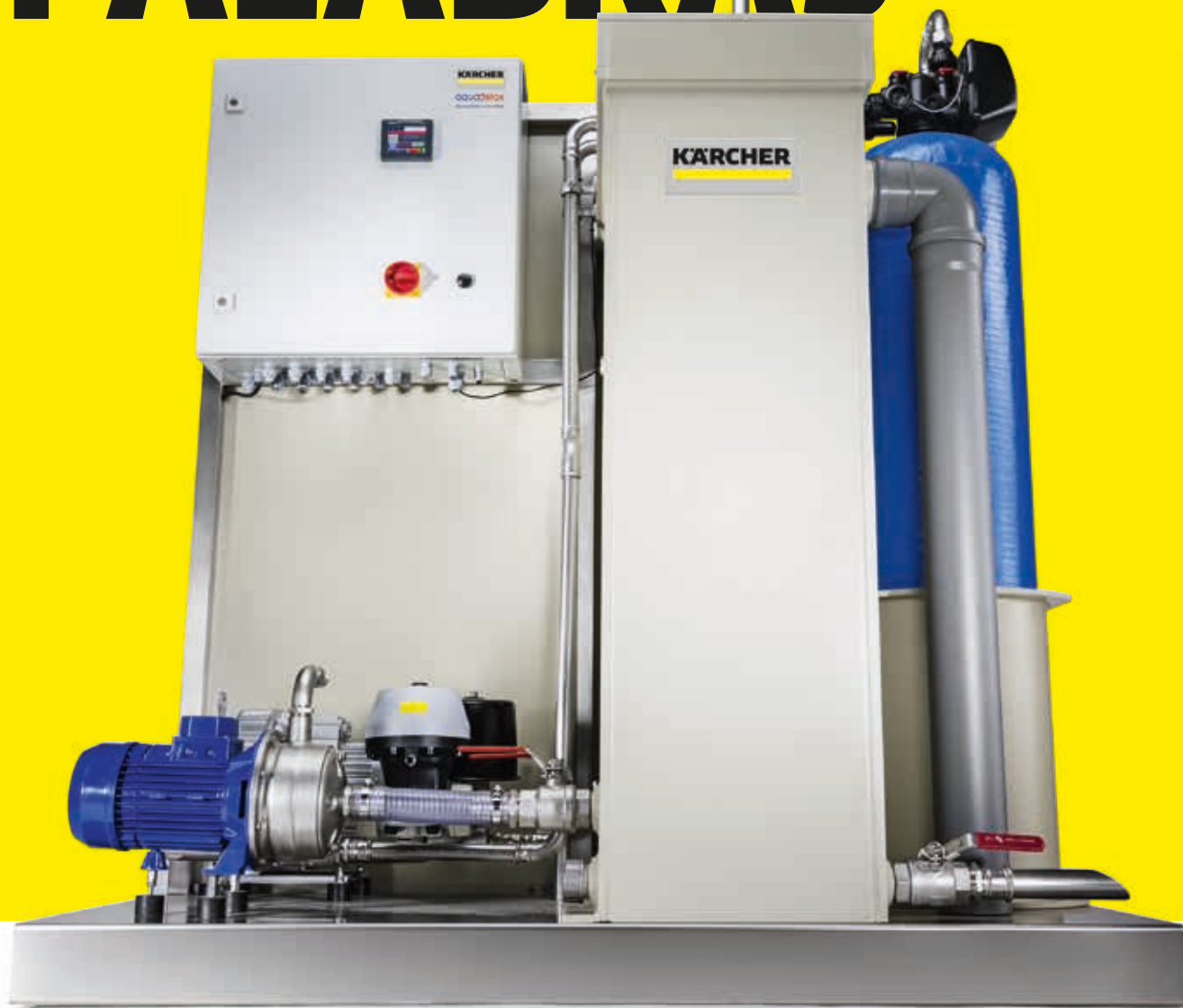
Sistema de reciclaje de agua WRB Bio