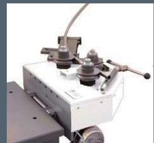
Dispositivo per scale / Staircase device Treppenhausvorrichtung

OMECC COSTRUZIONI MECCANICHE ENGINEERING