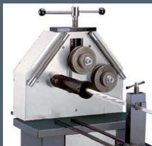
Attorcigliatura / Twisting / Verdrehen