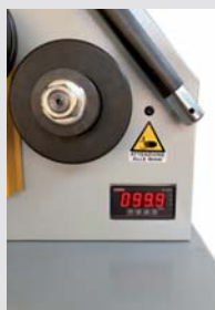
Visualizzatore digitale Digital display Digitale anzeigegeerate

FX5.1 series profile bending machines are able to process both horizontally and vertically and the three smooth or grooved rolls are in heat-treated NiCrMo alloy steel for the maximum durability over time. Rotation is powered by an electric gear motor, delivering high torque and positioning accuracy, while the two manual side corrector rolls provide control over the bending process. The bending process is controlled by means of the mobile control pedal unit. An optional inverter can be installed to provide variable roll rotation speed. Easy to use, rugged and reliable, FLEXP profile bending machines guarantee a high processing quality standard for a wide variety of sectors.