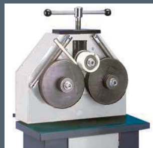
Rulli speciali / Special rolls / Spezial walzen