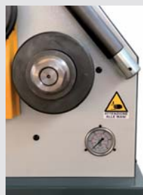
Controllo pressione Pressure control Druckregelung