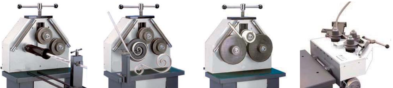
Alcuni esempi di rulli speciali / Some example of special rollers / Einige Beispiele für spezielle Rollen