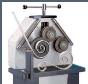
Ricciolatura / Curling / Schnörkelbiegen