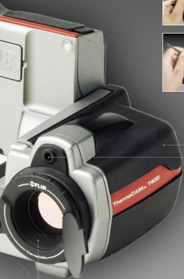
Unidad de lente inclinable