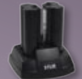
Cargador de batería