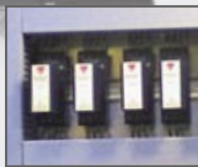
Inspección de un techo interior. Imagen térmica, Fusión térmica e imagen visual.

La nueva serie T de cámaras de infrarrojo de FLIR Systems es algo que nunca ha visto anteriormente. Es súper compacta y ultra ligera . Se comunica de manera fantástica con el software y el mundo que la rodea. Es increíblemente fácil de usar gracias a sus características únicas , como pantalla táctil , anotaciones de texto y dibujo, una lente giratoria (adaptable verticalmente) y funciones de alarma para aplicaciones específicas. También dispone de características adicionales de gran utilidad como una cámara digital integrada , y la posibilidad de fusión en una imagen de la imagen infrarroja y la imagen visual.