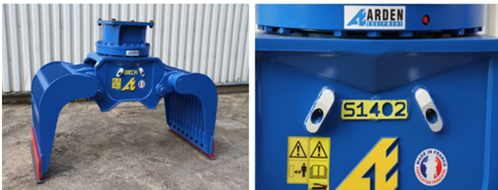
S1402 - opción Arden Jet