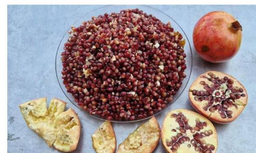
4. Todo en uno