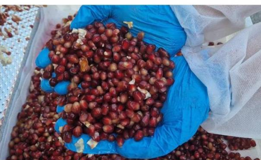
2. Producto final