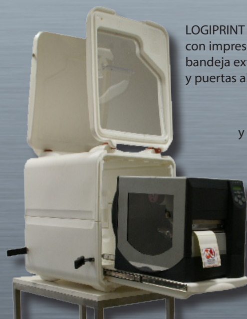
LOGIPRINT con impresora sobre bandeja extraíble