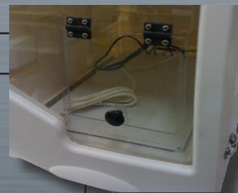
Salida TAV L 24