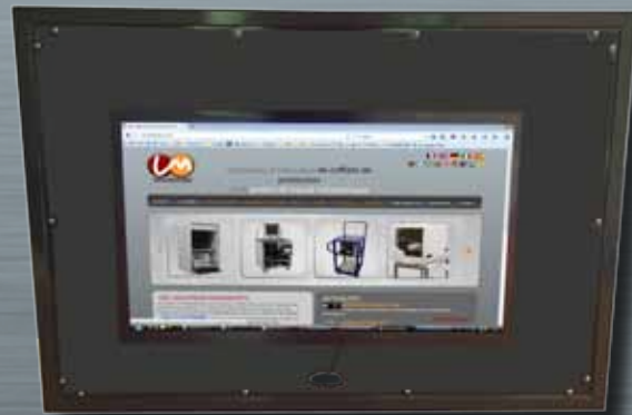
PI TV con la vidria anti-reflejo