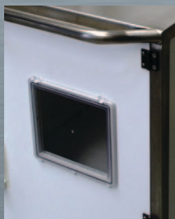
Salida TAV L 24