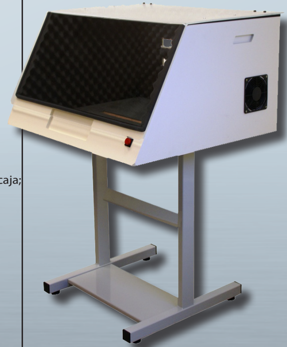
CAJA DE INSONORIZACIÓN con Opción Soporte SC 1