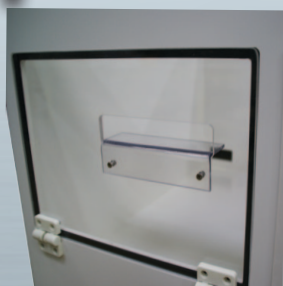
Salida Luz + Guía