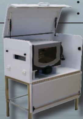
ZAG FD con Opción LUMIERE + GUIDE (luz + guía)