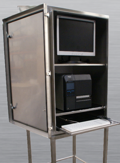
AGRO INOX LC abierto con bandeja del teclado extraída