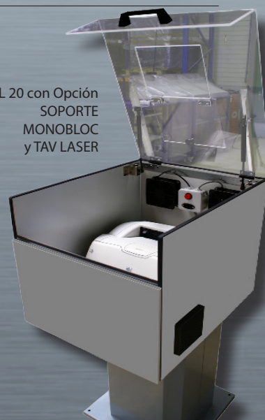
IL 20 con Opción SOPORTE MONOBLOC y TAV LASER