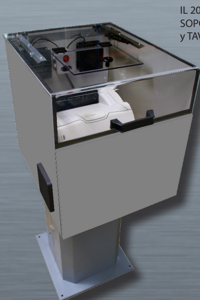
IL 20 con opción SOPORTE MONOBLOC y TAV LASER