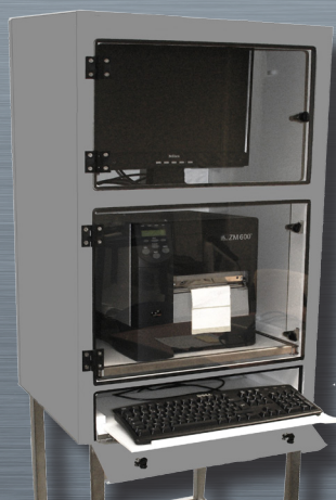
CPI 3 con bandeja teclado extraída