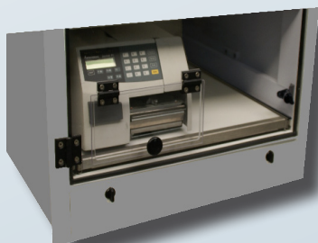
Salida TAV L12