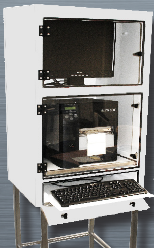
CPA 3 con bandeja teclado extraíble